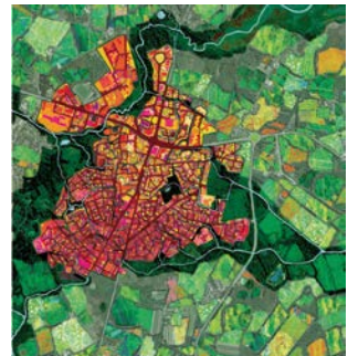
L'étoffe des villes 37 VARIATIONS URBAINES Sylvain Coquerel

Atelier d'une heure et demie pour les 9-11 ans sur la densité en lotissement. À partir de la maquette d'un lotissement, réalise le projet de vie de la famille «Bidule» et redessine ce petit quartier tout en respectant le projet de la commune et les règles d'urbanisme.