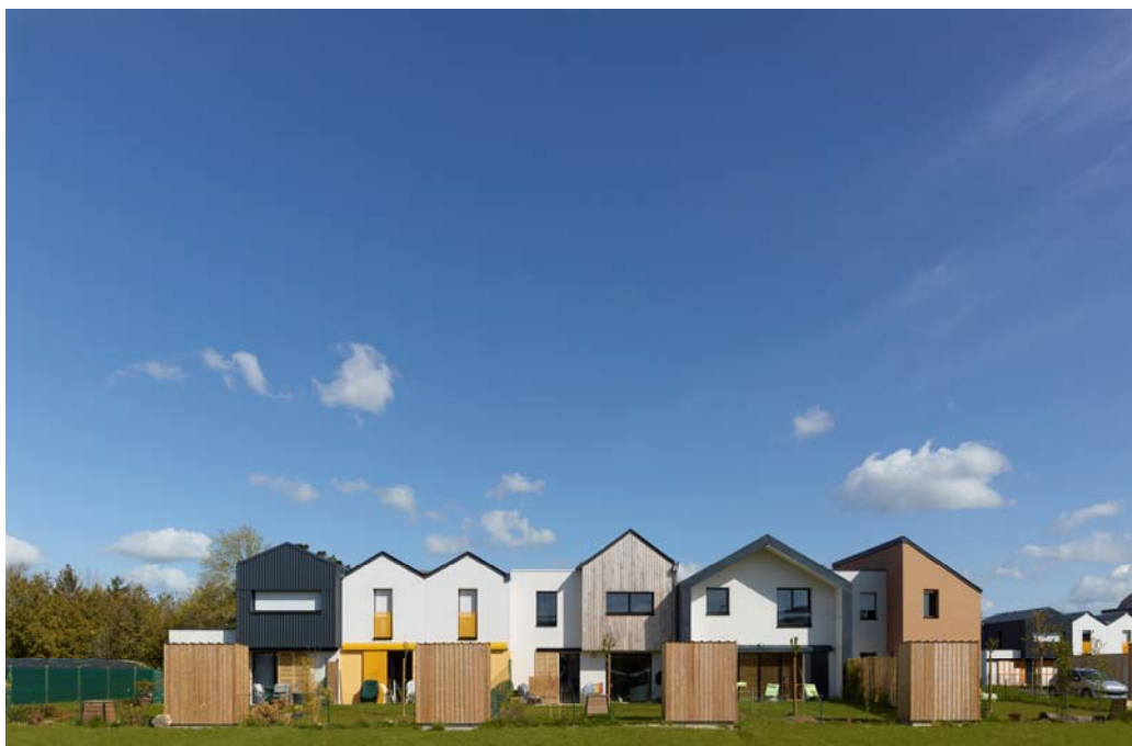
Vert Buisson à Bruz (35) lauréat du Prix Architecture Bretagne 2012 dans la catégorie Habiter ensemble Architectes : Anthracite Architecture 2.0, Atelier Parallèle, Gwenola Gicquel, Jolivet-Roche, Sourimant-Guyot

L'exposition du Prix Architecture Bretagne 2012 réalisé par la MAeB sera présentée à l'Hôtel de ville de Quimper du 11 au 23 mars